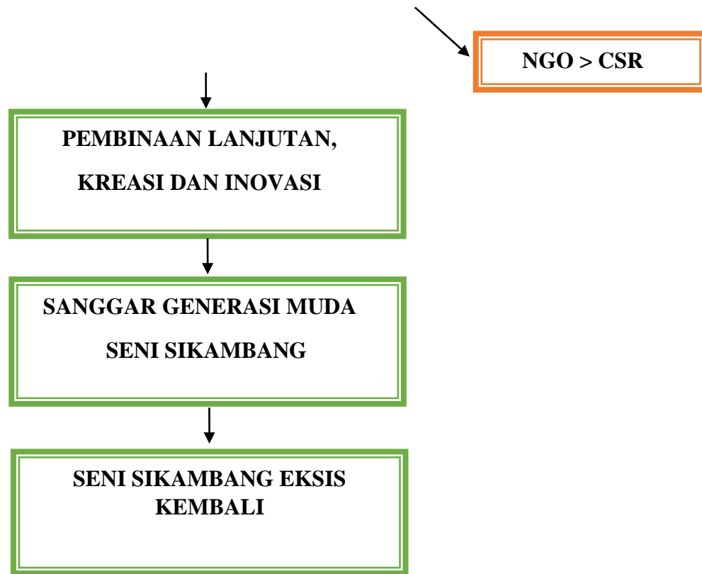
Gambar. Kerangka konsep Sikambang Young Generation